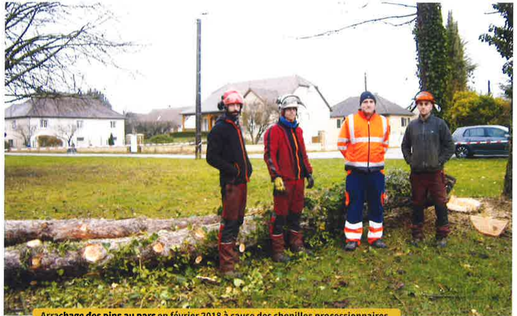
Arrachage des pins au parc en février 2018 à cause des chenilles processionnaires