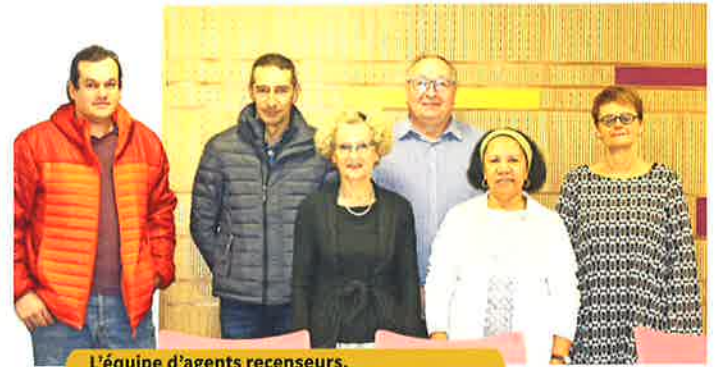
L'équipe d'agents recenseurs. Chaussin compte désormais 1 692 habitants.