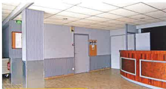
Peinture de la salle des fêtes