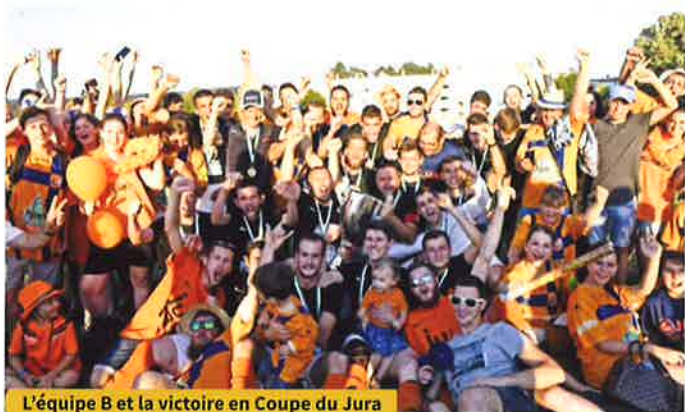
L'équipe B et la victoire en Coupe du Jura