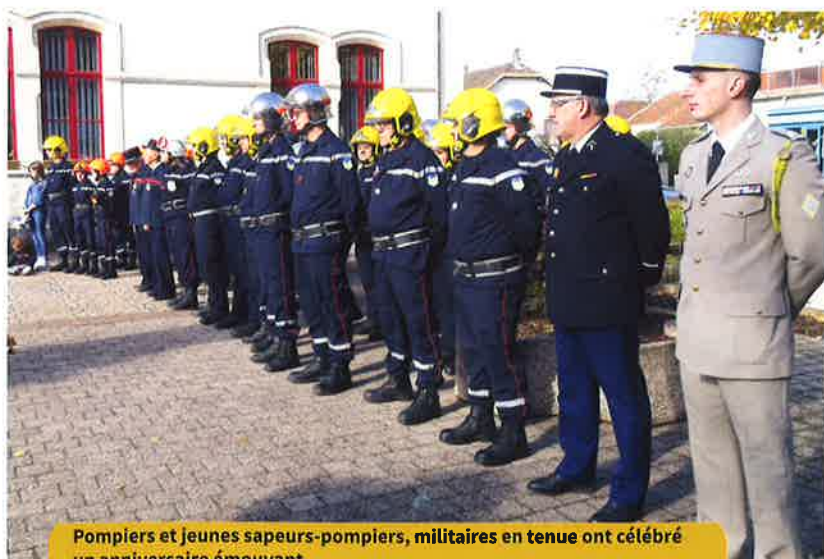
Pompiers et jeunes sapeurs-pompiers, militaires en tenue ont célébré un anniversaire émouvant.