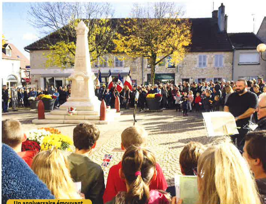
Un anniversaire émouvant

Les jeunes ont animé cette cérémonie "pour que personne n'oublie" avec des textes émouvants. La Lyre chaussinoise a rehaussé cette commémoration et La Marseillaise a été reprise en chœur par toute la foule émue.