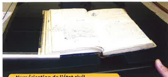
Numérisation de l'état civil