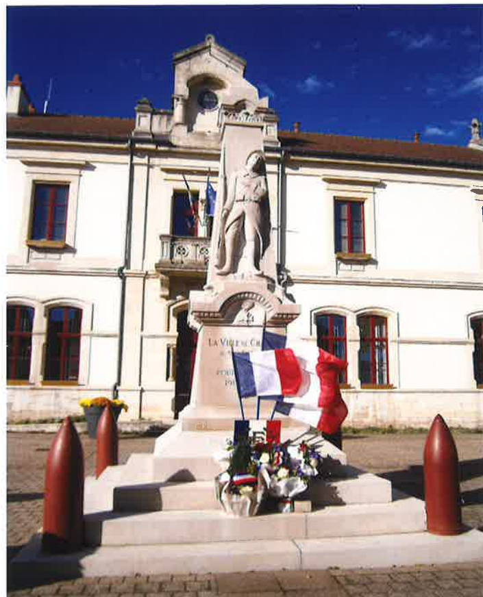
Entre 1918 et 1925, plus de 30.000 monuments aux morts sont ainsi commandés

Mais si les monuments aux morts portent les noms des défunts de la commune, les morts en question sont loin d'être tous inhumés dans leur ville ou leur village. Souvent ils reposent dans de vastes cimetières militaires dont le plus célèbre, en France est l'ossuaire de Douaumont. Qui regroupe les restes de 130.000 soldats inconnus, français et allemands.