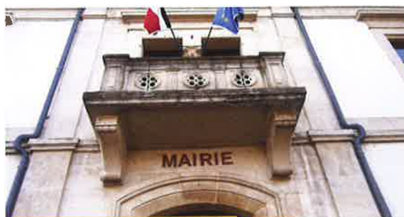
Lettres sur fronton de la mairie