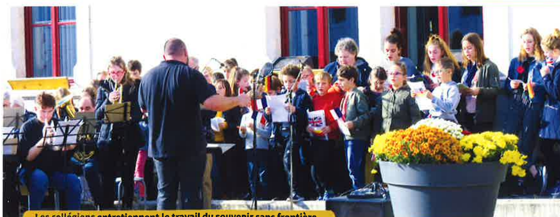
Les collégiens entretiennent le travail du souvenir sans frontière