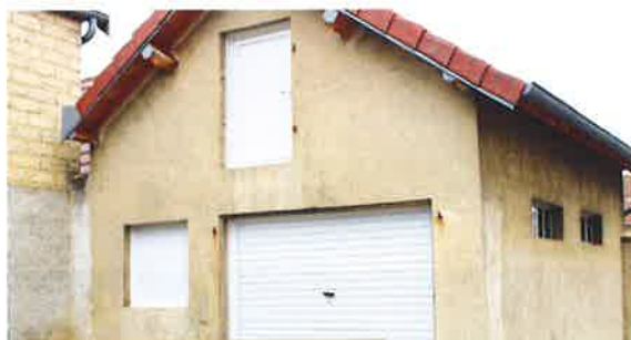
Garage dans la cour de la mairie