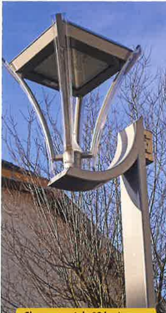
Changement de 13 lanternes